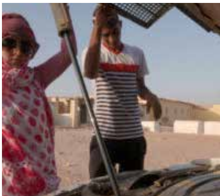
Stillbild ur Hamada

Instängda i ett flyktingläger mitt i Saharaöknen lever saharierna, ett fiskarfolk som tvångsflyttats hit från havet. Här filmar Eloy Domínguez Serén tre unga vuxna som vägrar att låta sig begränsas av instängdheten. Liksom ungdomar över hela världen drivs de av sina drömmar. Efter filmen bjuder biblioteket på fika och vi diskuterar filmen. Lös medlemskap för 20 kr på Biblioteket i Handen. Mer information på bibliotek.haninge.se . Auditoriet.